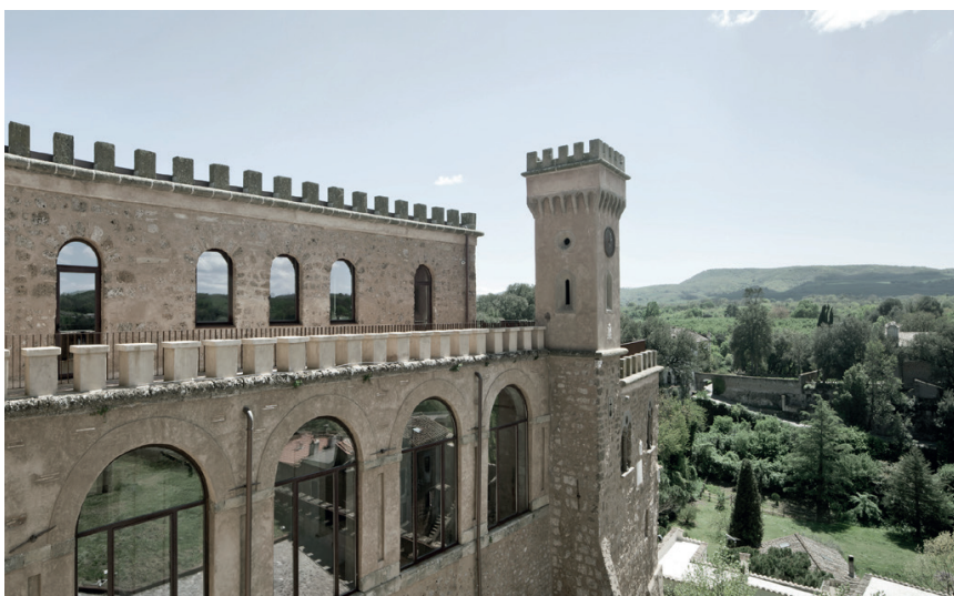
Sponsorizzazione catalogo - Progetto di conservazione e trasformazione MUSEO DI PALAZZO DOEBBING